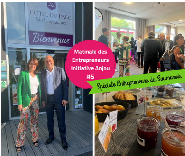
Matinale des Entrepreneurs à Saumur

5 matinales des entrepreneurs 1 afterwork