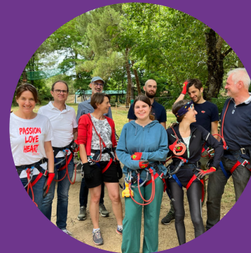
Journée avec les développeurs économiques