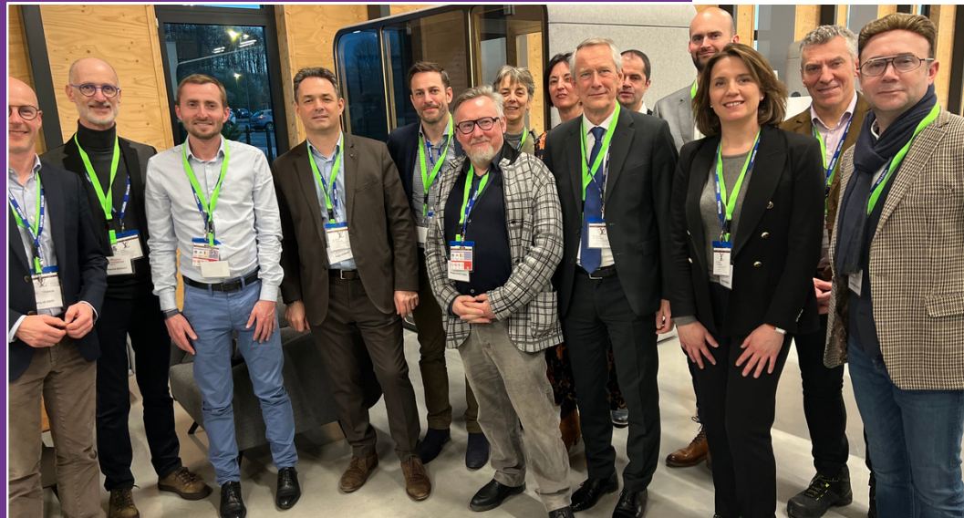
Soirée Mécènes & Partenaires