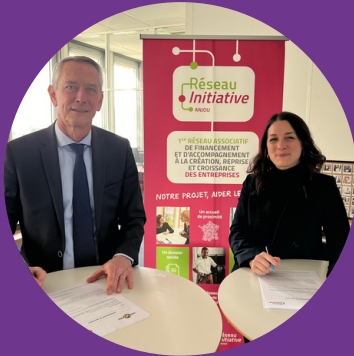
Signature partenariat Groupe Luc Durand