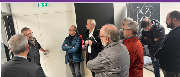
Visite avec les élus dans le Baugeois