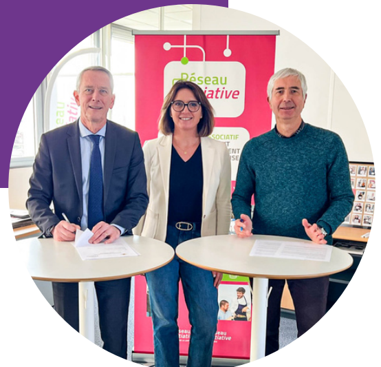
Signature partenariat Apesa